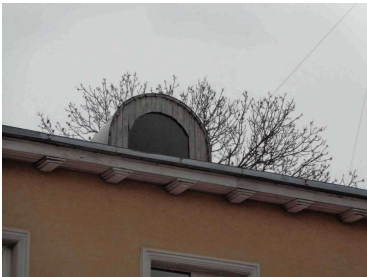
Слуховое окно на кровле «ПАМЯТНИКА»