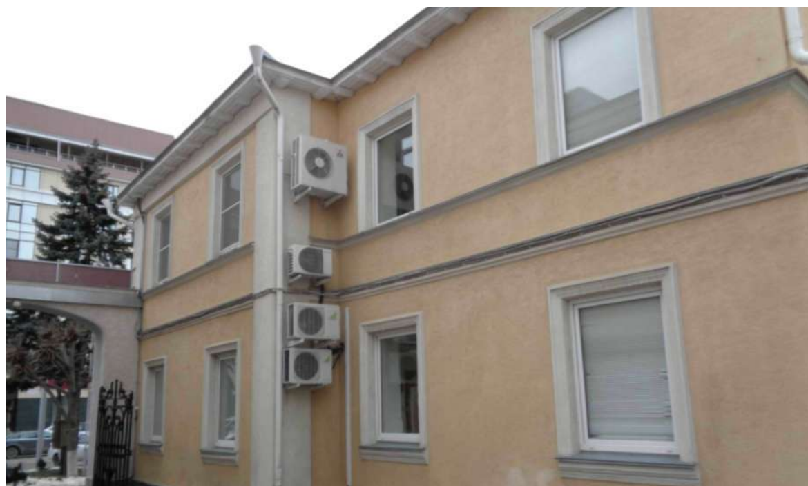
Восточный (дворовой) фасад «ПАМЯТНИКА»