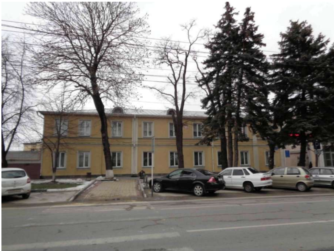
Главный (южный) фасад «ПАМЯТНИКА» по ул. Советской