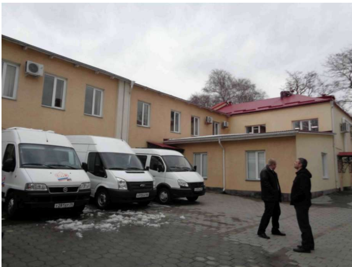
Часть дворового фасада «ПАМЯТНИКА»