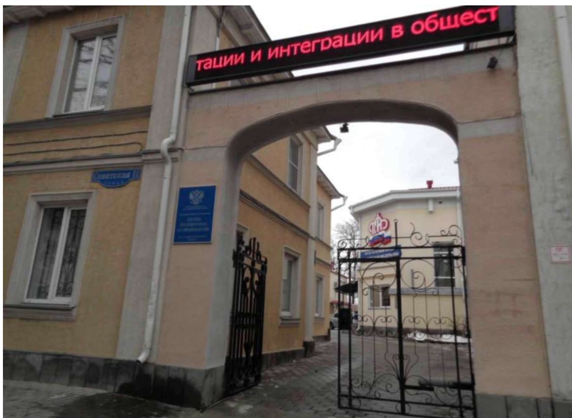
Арка входа во двор «ПАМЯТНИКА» со стороны ул. Советской