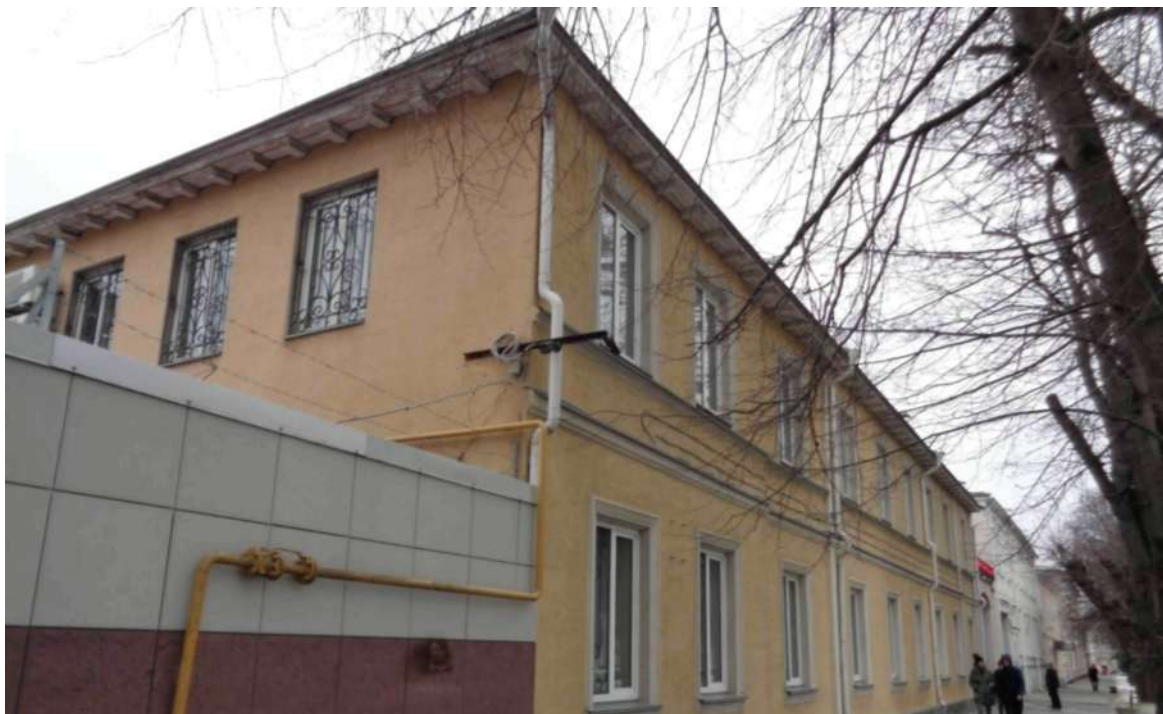
Вид с запада на главный фасад «ПАМЯТНИКА»