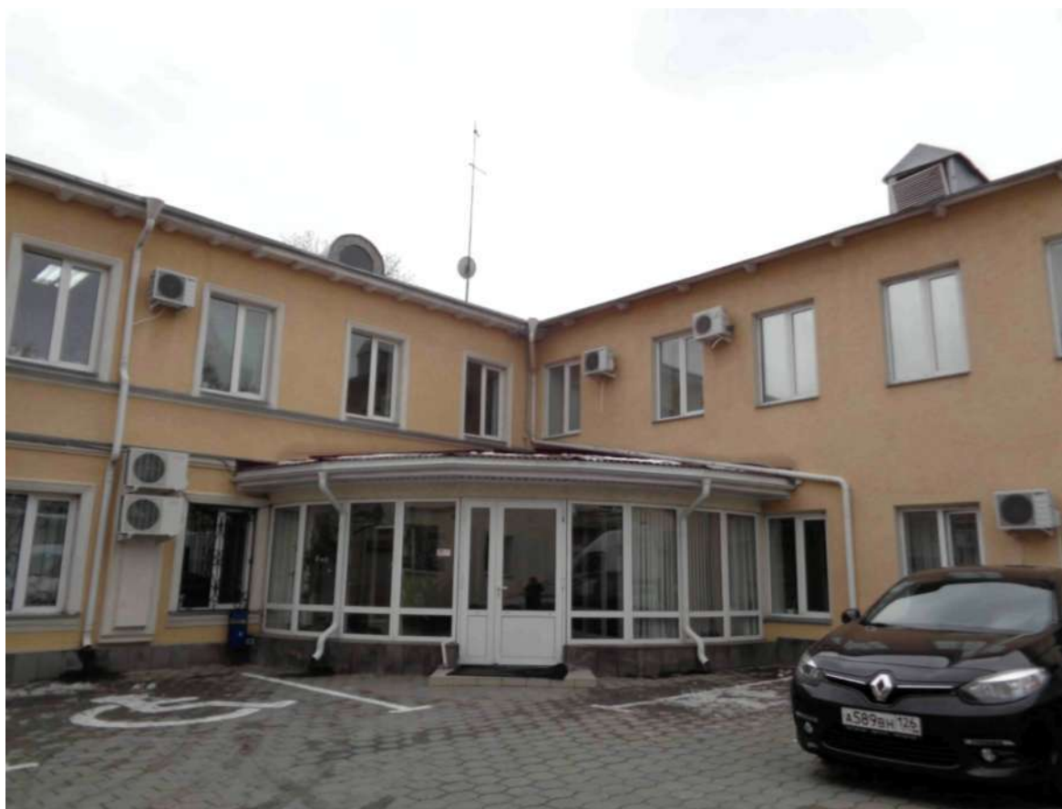
Часть дворового фасада «ПАМЯТНИКА»