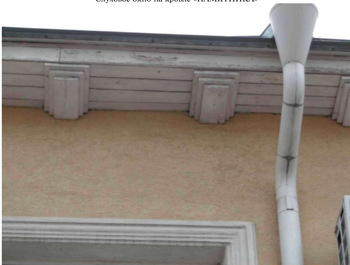
Фрагмент фасада «ПАМЯТНИКА»