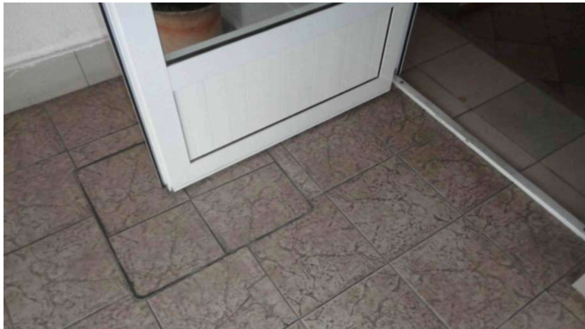
Фрагмент покрытия пола «ПАМЯТНИКА»