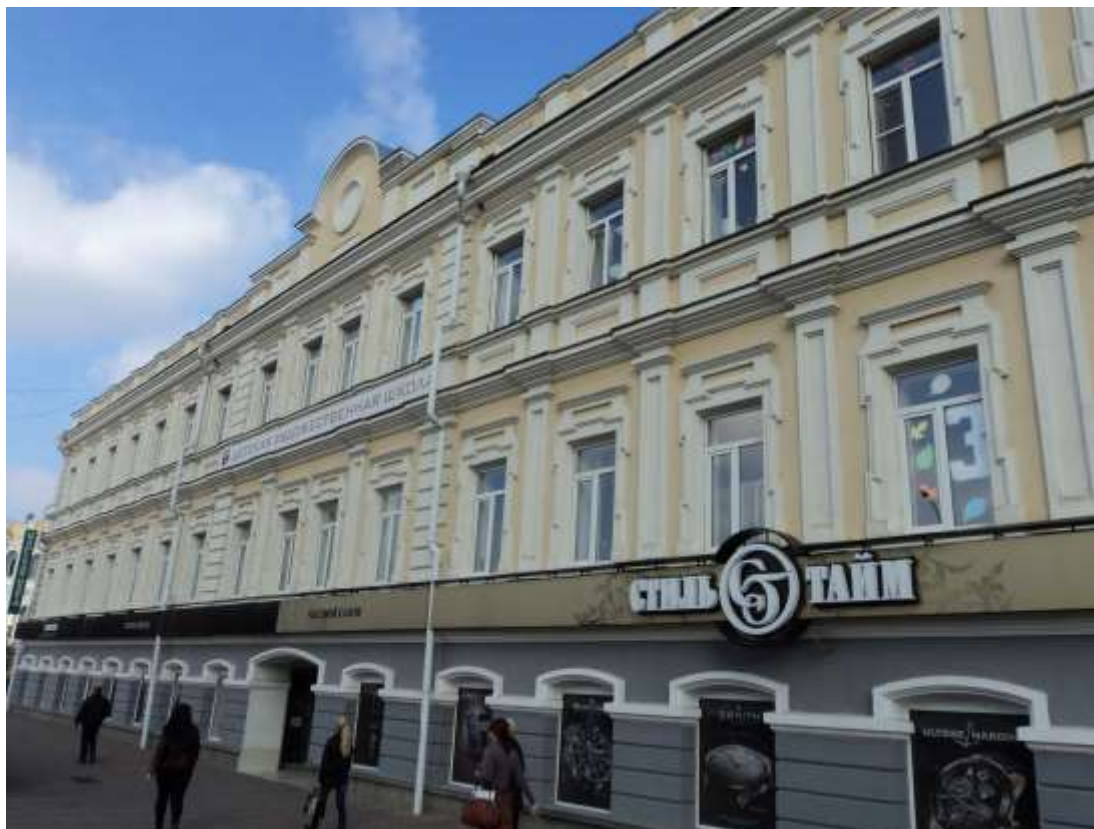
Вид северного фасада памятника