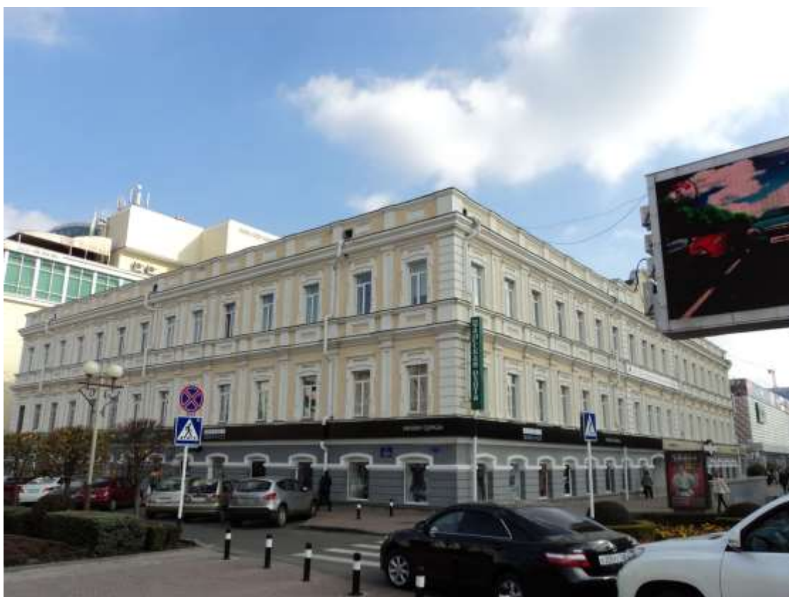
Вид главного фасада памятника