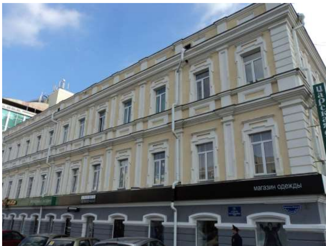
Вид западного фасада памятника